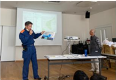
消防団による利用案内の様子