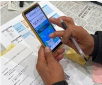
スマートマップを利用している様子