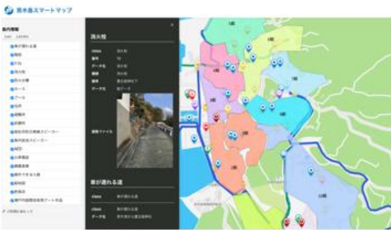
男木島スマートマップ