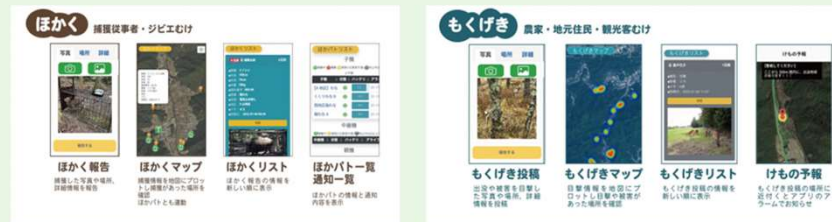
捕獲投稿や、子機の情報も一括管理